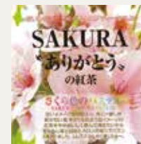
さくら色のパステル (さくらんぼ・白桃・メロン)