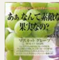
マスカットグレープ (マスカット・グレープ)