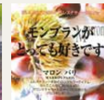
マロンパリ (マロン・キャラメル)