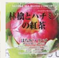
はちみつリンゴ (アップル・サワーサップ・メープル・ヨーグルト)