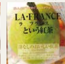
洋なしのおいしい紅茶 (洋ナシ)