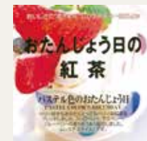
パステル色のお誕生日 (ストロベリー・ラズベリー・ブルーベリー)