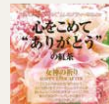
女神の祈り (アップル・バニラ・アールグレイ)