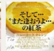
ニューヨークオレンジ (オレンジ・マンゴ・ストロベリー)