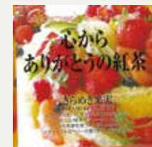
きらめき果実 (ストロベリー・バナナ・パイナップル)