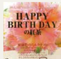
亜麻色のミルクティー (キャラメル・パイナップル・バナナ)