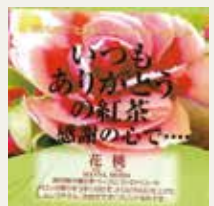
花桃 (白桃・ストロベリー・メロン)