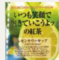
レモンサワーサップ (レモン・サワーサップ)

新作のパッケージ達のメッセージやデビッドKのメッセージ(ボエム)もムレスナティーの特徴の一つですが、不定期に定番のアイテムもパッケージも変更があります。もちろんフレーバーを楽しんでいただきたいのですがパッケージに込められたメッセージも合わせて味わっていただきたいと思ひます。