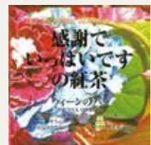
ウィーンの薔薇 (ローズ・ジャスミン・白桃・りんご)