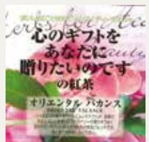
オリエンタルパカンス (ジャスミン・ストロベリー・マンゴ)